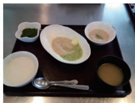
ミキサー食、お粥 とろみ（から揚げ）