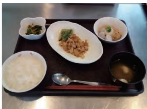
きざみ食、軟飯（から揚げ）