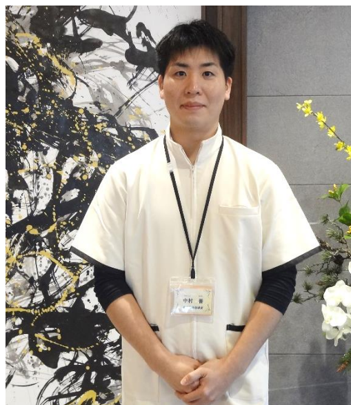
柔道整復師・機能訓練指導員

皆様が参加できるような プログラムも考えています。 ぜひ一緒に健康で長生きしましょう！