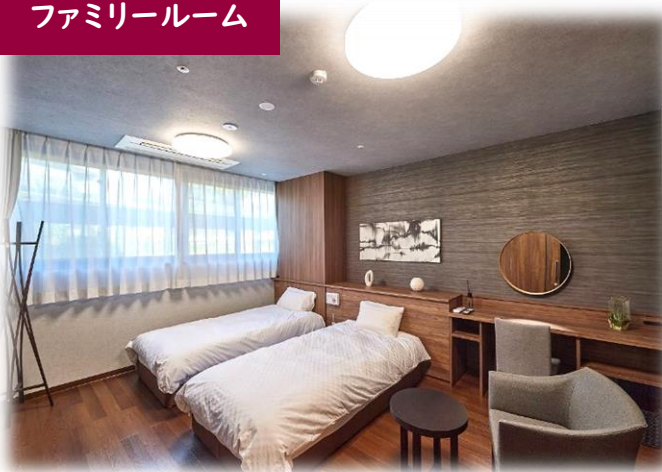
ファミリールーム