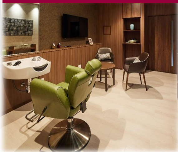
ビューティールーム:サロン・ド・プリモ

◇遠方からの来客の際はもちろん、 ご入居時の不安を解消するためにご家族がお泊り頂く事も出来ます